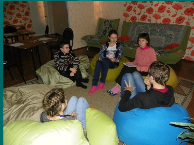
«Практическая психология. Сад чувств и эмоций»