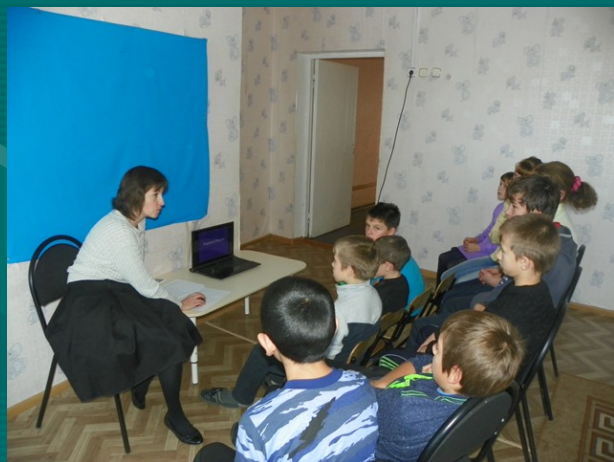
Беседы с детьми, групповые занятия по психологическому просвещению