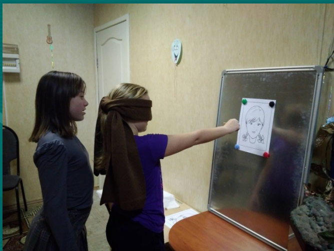
«Практическая психология. Путешествие в страну внимания»