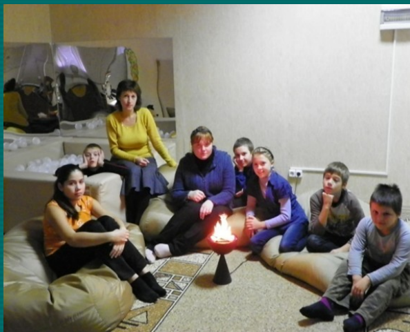
Релаксация в сенсорной комнате