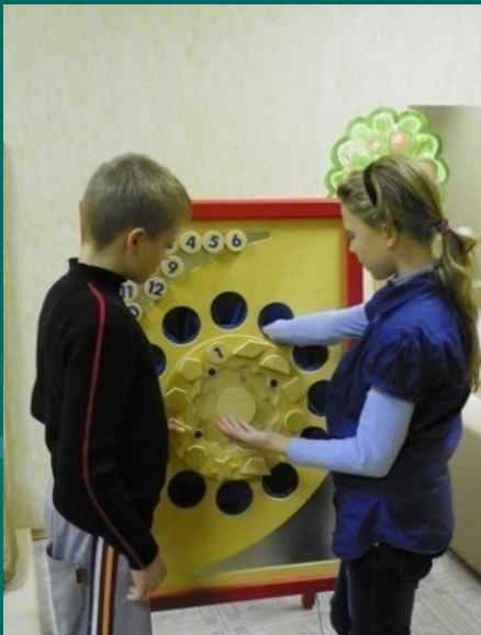
Коррекционные игры и занятия в сенсорной комнате

Педагог-психолог использует разные формы работы по устранению отклонений в психическом развитии, нарушений социального развития несовершеннолетнего, формированию его способностей и личности